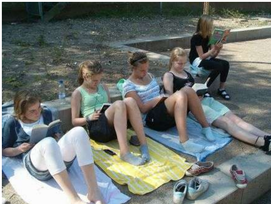
Pigerne læser frilæsning i det gode vejr. Lagt ind af ME den 19-06-2007